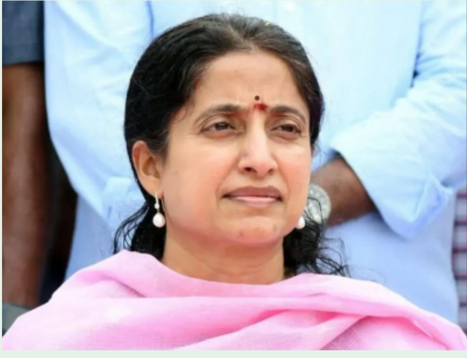
విజయవాడ, భారత శక్తి ప్రతినిధి, జనవరి 05: